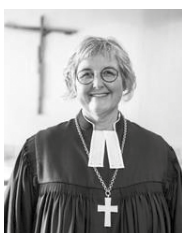
Landesbischöfin Heike Springhart