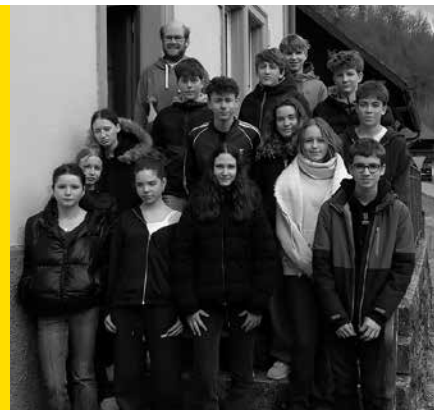
bild. Wie stellt ihr euch Gott vor? Außerdem gestalteten die Jugendlichen mit viel Herzblut ihre Konfirkerze. Es entstanden einzigartige, schöne Erinnerungsstücke.

Das „Chaosspiel“ und „Schlag das Team“ haben die Gemeinschaft gestärkt, wobei noch genug Zeit zur freien Gestaltung blieb.